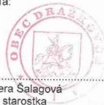
Viera Šalagová starostka