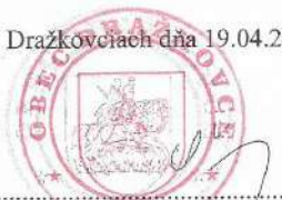
Viera Šalagová - starostka