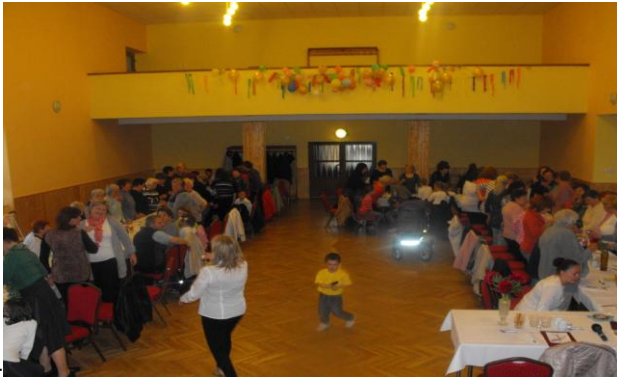
Deň Matiek 2. májovú nedeľu